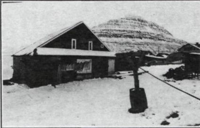
Dvottur úti á snúru — Hólmátindur í bakaefn.